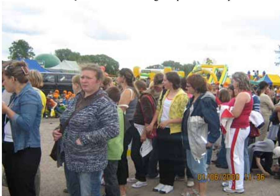
W kolejce po paczki

1 czerwca nasi uczniowie świętowali w Elku na Ogólnopolskim Festynie Rodzinnym.