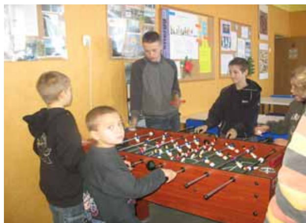
Turniej Piłki Nożnej Stołowej