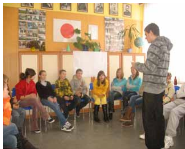
Przyjazd grupy z Monet do naszej szkoły