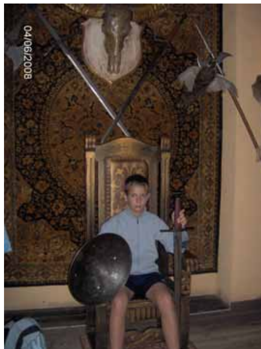
A to? Król Maciuś ?

Następnie mogliśmy podziwiać niezwykle zwierzęta w ich naturalnym środowisku. Były tam żubry królewskie, daniele albinosy, owce wrzosówki, kozy, dziki.