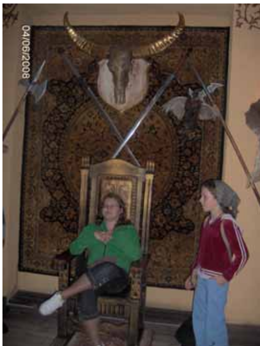
Czyżby przyszła królowa Elżbieta?