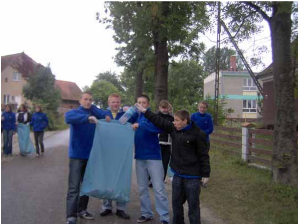
KLASA II G