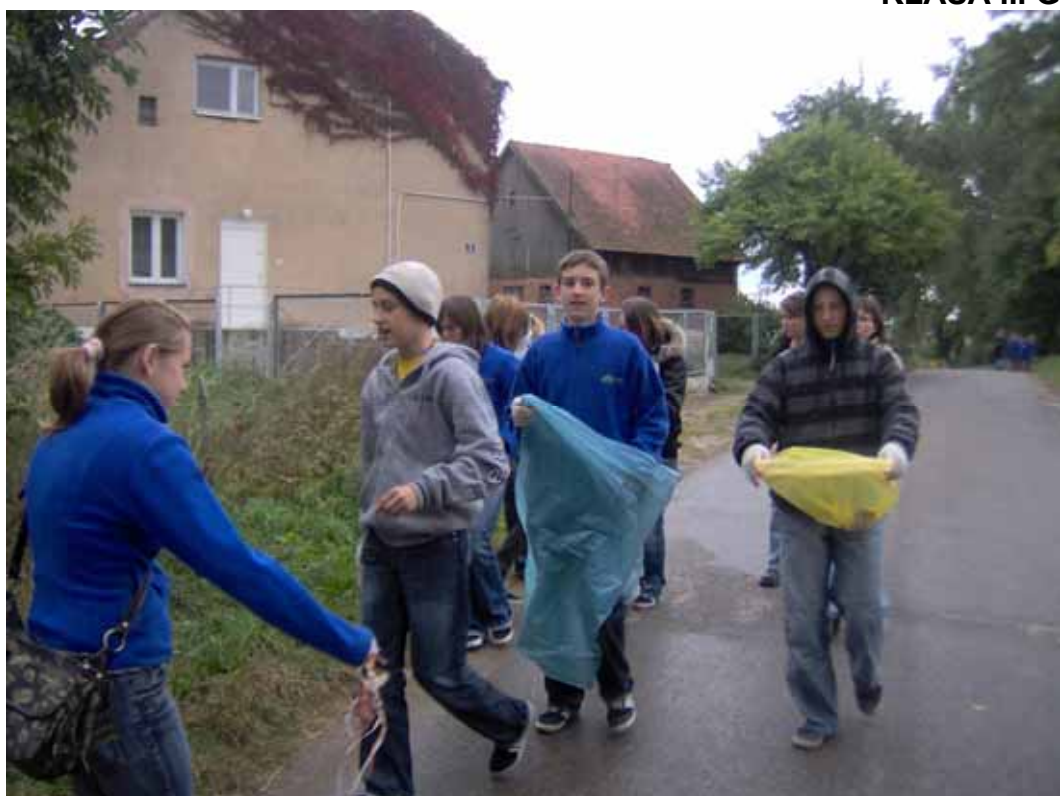
KLASA III G

W krajach wysoko uprzemysłowionych przeciętna rodzina wyrzuca ponad tonę śmieci rocznie. Większość śmieci to papier z opakowań i odpadki kuchenne. Wiele składników można wykorzystać powtórnie.